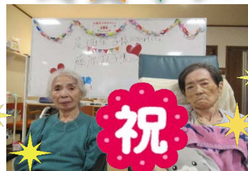
8月のお誕生者です♡